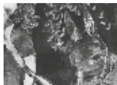
Pour Kaspar Hauser (détail) Anna Picco, fusain sur papier, 160 x 186 cm 2020

Pour l'exposition, elle invite le visiteur à se plonger dans un univers à dominance noir et blanc, peuplé de figures mystérieuses venues hanter notre société moderne.