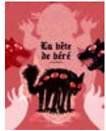
Affiche réalisée pour la résidence par Jeanne Boukraa.

Sur inscription : culture@cc-chateaubriant-derval.fr