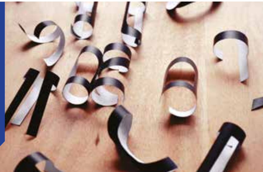
Mue du poème : serpent cyprès - Xabi Ambroise, photographie argentique, tirage jet d'encre, 15 x 10 cm, 2017