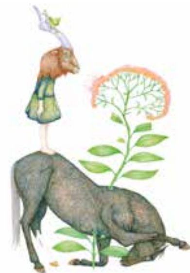
Little - Delphine Vaute, crayon et feutre sur papier, 40 x 50 cm, 2020