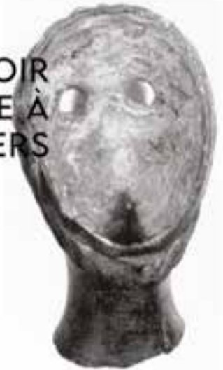
Voir la feuille à l'envers - Coline Cuni, Image source : René Sanquer. La grande statuette en bronze de Kerguilly-en-Dinéault. Éditions du CNRS, 19732020