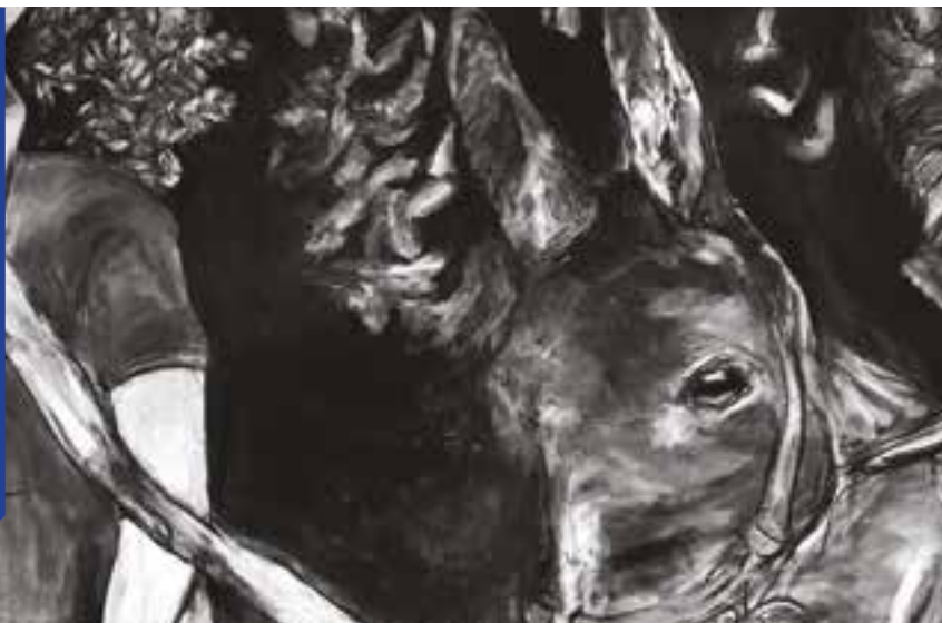
Pour Kaspar Hauser (détail) - Anna Picco, fusain sur papier, 160 x 186 cm, 2020