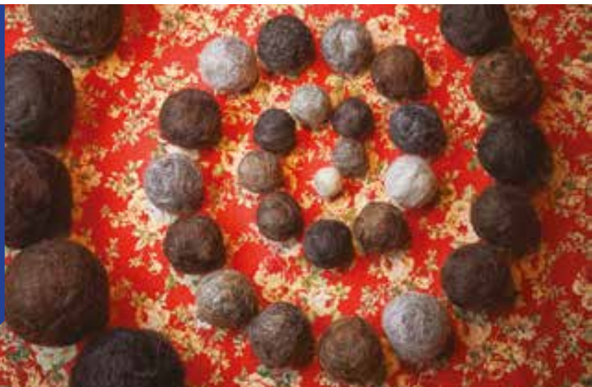
Energie capillaire - Sofie Vinet, impression sur dibon, 100 x 100 cm, 2020