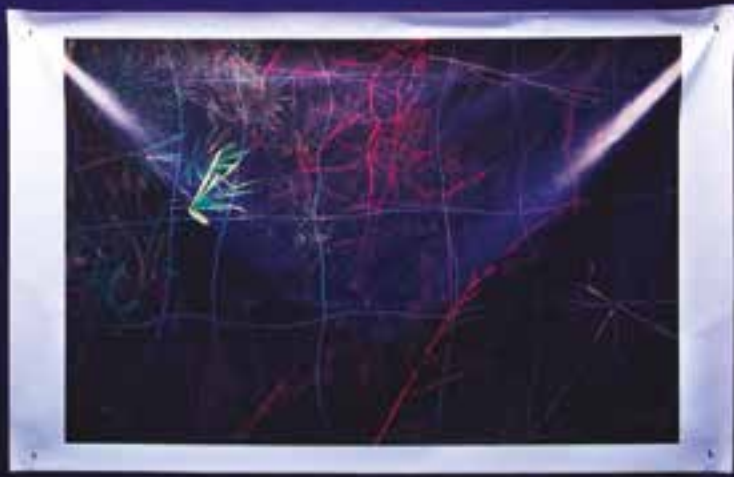
Destination, pour une image lue - Corentine Le Mestre, impression sur toile, image performée à Kochi en Inde, 2018

corentinelemestre. wixsite.com/corentine- lemestre fracdespaysdelaloire. com