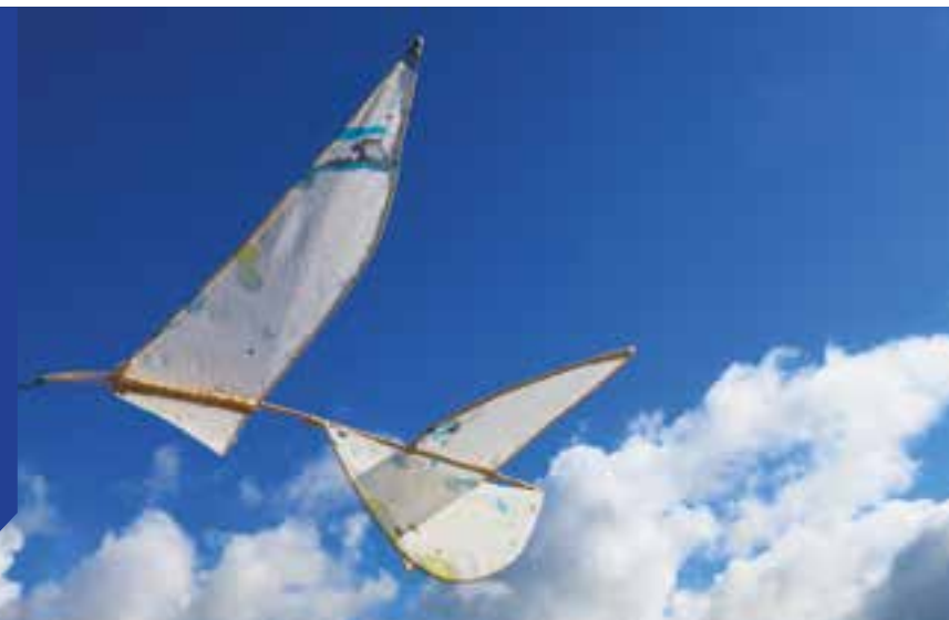
Maquette - Marine Class, osier et soie imprimée, environ 80 x 50 x 20 cm, 2021