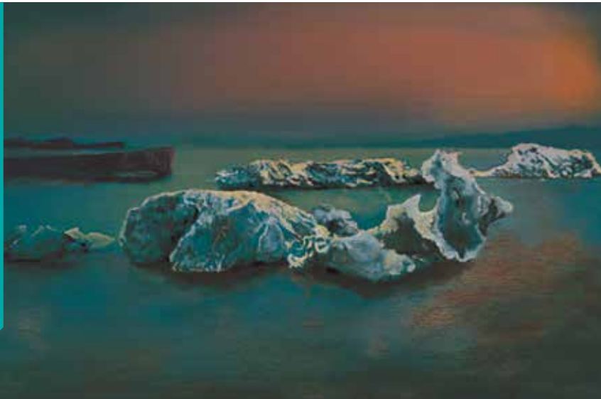
D'après l'œuvre littéraire De pierre et d'os de Bérengère Cournut - Julie Giraud, sérigraphie, 2019

https://atelierdubourg.fr/adb/portfolio/les-400-coups-6/