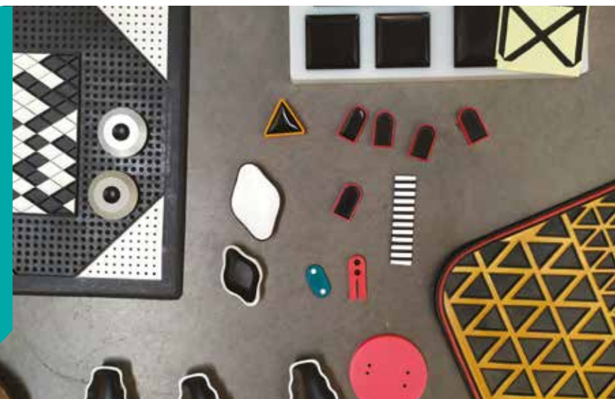
Vue d'atelier - Anthony Bodin, 2022