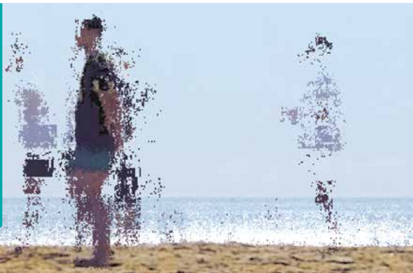
Marbella Pixel Painting, détail - Isabelle Dehay, impression digigraphique 50 x 100 cm, 2020

https://www.reseaux-artistes.fr/dossiers/isabelle-dehay/#travaux