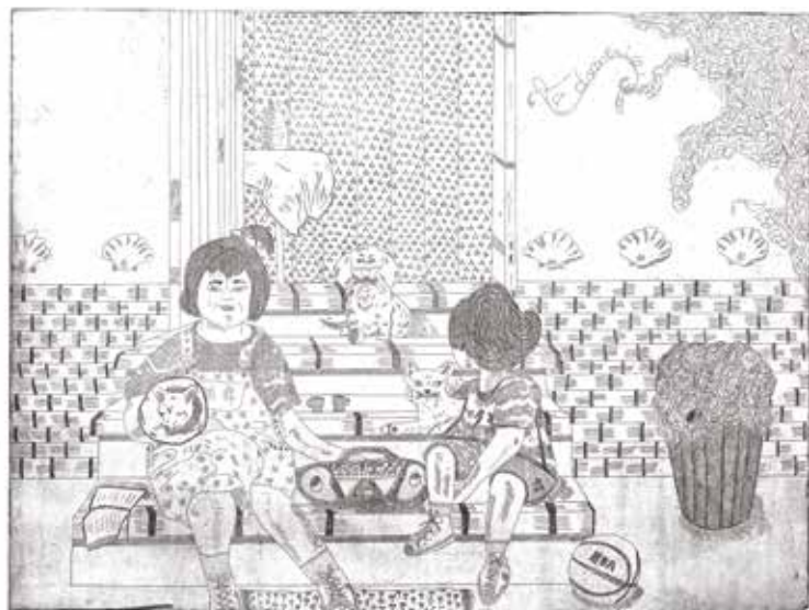
La domenica - Giovanna Chauvin Rossi, gravure à l'eau forte sur papier velin d'arches, 57 x 38 cm, 2022