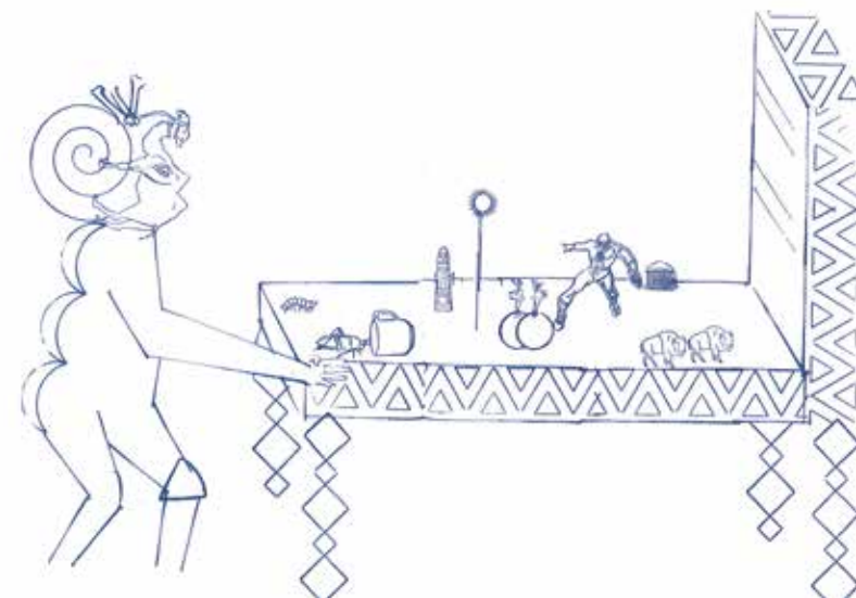
Sans titre - Richard Fauguet, 2018 - Collection Frac des Pays de la Loire