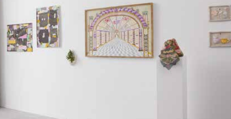
Le champ du signe - Johann Bertrand Dhy, exposition aux ateliers Bonus, Nantes, 2019.