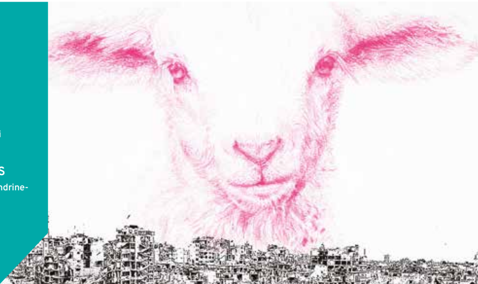
L'appât (série AUTREMENT) - Sandrine Fallet, dessin, crayons de couleur, 29,7 x 42 cm, 2020 et dessin préparatoire ALEP, 2017