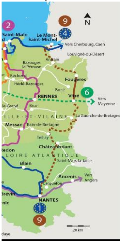
Le tracé global