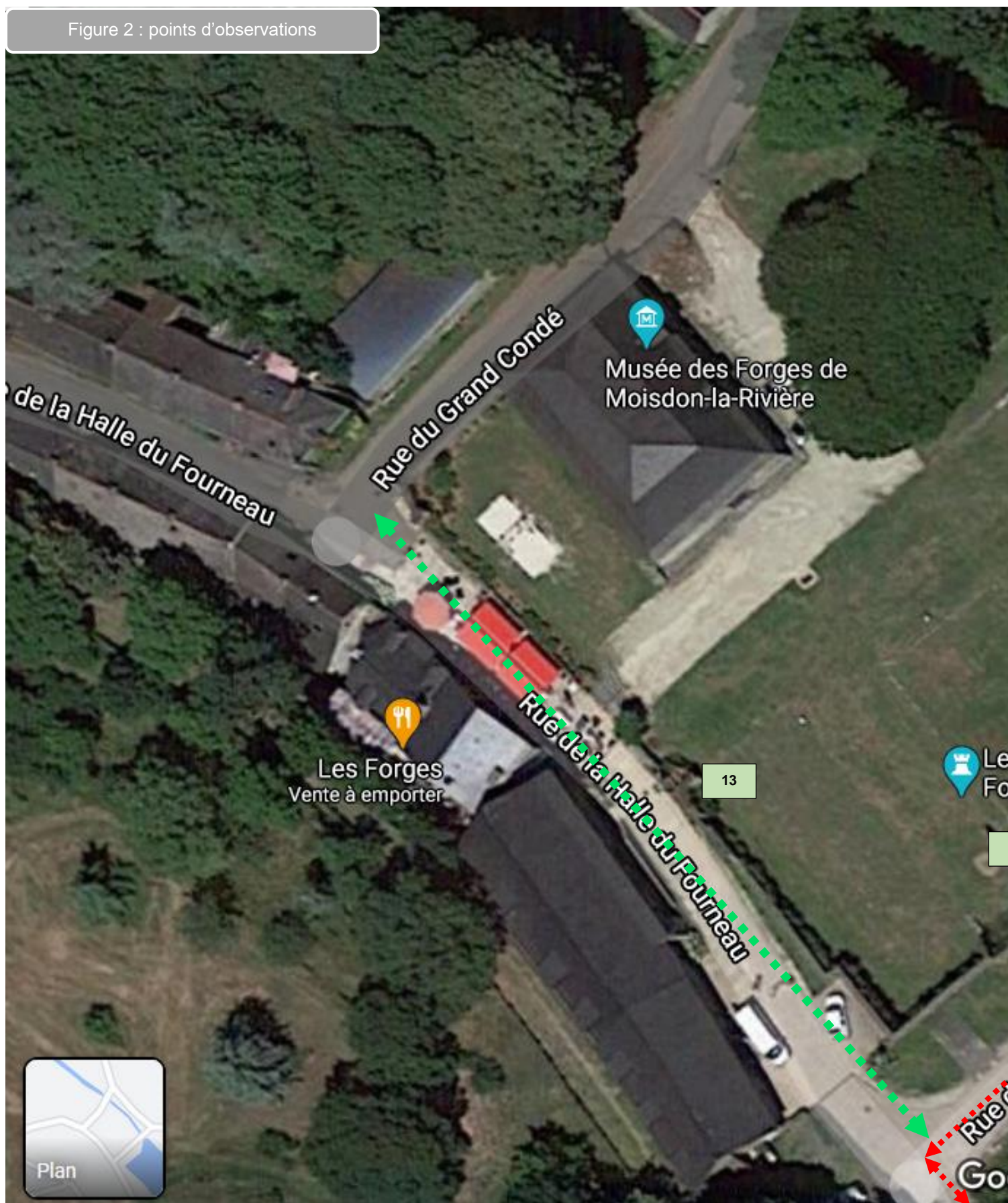
Figure 2 : points d'observations