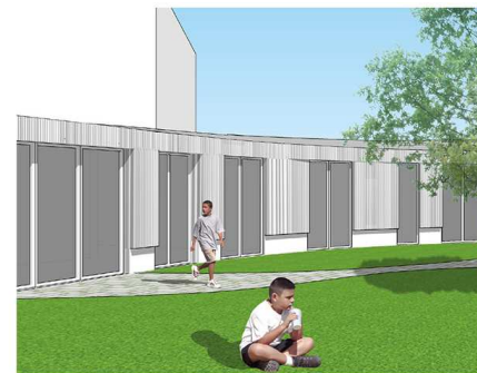
PERSPECTIVE DEPUIS LE JARDIN