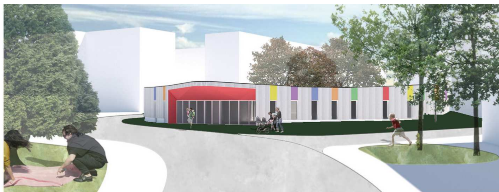
PERSPECTIVE VERS L'ENTRÉE RUE JACQUARD

Fin de l'opération prévue : Septembre 2020